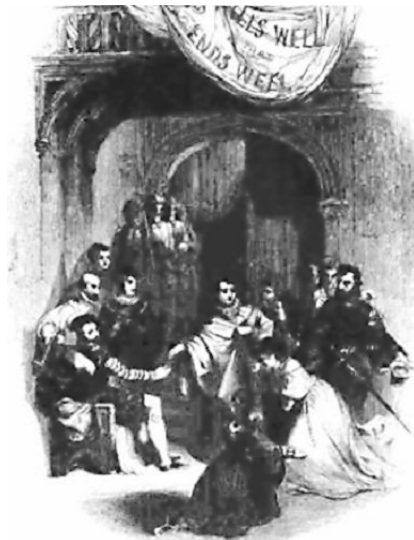
Illustration de Audibran.

Par François Pierre Guillaume Guizot - 1821