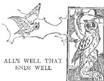
Illustration de Arthur Rackham - 1909

En Roussillon, tout le monde fait semblant de porter le deuil d'Hélène. Le roi est en visite, et consent à un mariage entre Bertrand et la fille d'un vieux partisan nommé Lafeu. Cependant, il remarque au doigt de Bertrand la bague qui appartenait à Hélène. C'est le cadeau qu'il lui avait fait lorsqu'elle lui avait sauvé la vie. Bertrand est bien en peine d'expliquer d'où elle provient. Diana et sa mère interviennent alors pour expliquer la supercherie conçue par Hélène. Cette dernière informe son mari que les deux conditions qu'il avait posé à la réalisation de leur union ont été remplies. Bertrand accepte les affirmations de sa femme, mais dans la plupart des interprétations modernes de la pièce, il garde son amertume.