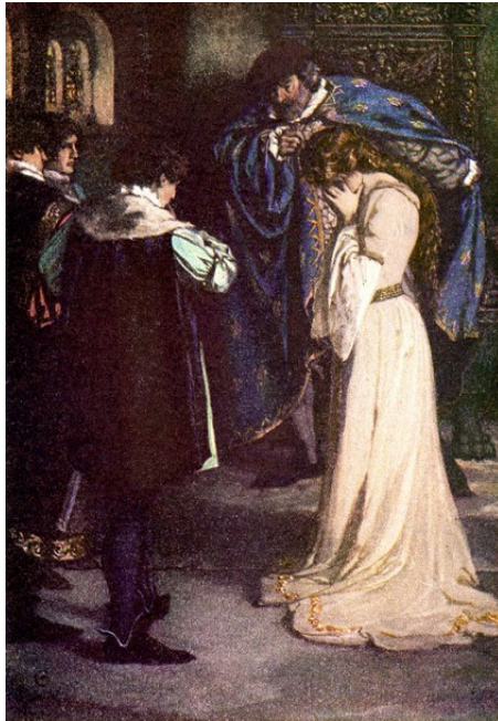
La scène est tantôt en France, tantôt en Toscane.

LE ROI DE FRANCE. LE DUC DE FLORENCE. BERTRAND, comte de Roussillon. LAFEU, vieux courtisan. PAROLLES 1 , parasite à la suite de Bertrand. PLUSIEURS JEUNES SEIGNEURS FRANÇAIS, qui servent avec Bertrand dans la guerre de Florence. UN INTENDANT, au service de la comtesse de Roussillon. UN PAYSAN BOUFFON, au service de la comtesse de Roussillon. LA COMTESSE DE ROUSSILLON, mère de Bertrand. HÉLÈNE, protégée de la comtesse. UNE VIEILLE VEUVE de Florence. DIANE, fille de cette veuve. VIOLENTA, voisine et amie de la veuve. MARIANA 2 , voisine et amie de la veuve. SEIGNEURS DE LA COUR DU ROI, UN PAGE, OFFICIERS, SOLDATS FRANÇAIS ET FLORENTINS.